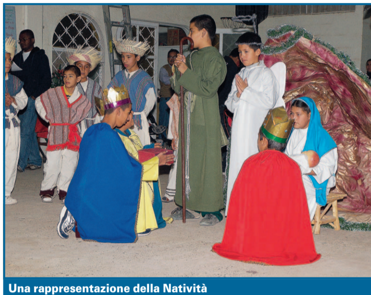
Una rappresentazione della Natività

«Fino al 23 dicembre si organizzano le Posadas, per ricordare il pellegrinaggio di nove giorni di Maria e Giuseppe prima della nascita di Gesù. Bambini e adulti si dedicano all'organizzazione di quest'evento, allestendo una piccola rappresentazione della natività (qualcosa di simile al nostro presepe), accendendo candele e fuochi d'artificio. E in ogni posada è d'obbligo la piñata, un contenitore fatto a mano con cartoncini e carta colorati che si appende al soffitto. Sebbene si tratti di un oggetto di origine cinese, qui in Messico è una tradizione ormai consolidata. All'interno ci si mettono dolcetti, caramelle, cioccolatini. Con gli occhi bendati, si cerca di romperla. È la rappresentazione della lotta interiore contro le tentazioni e il male, per