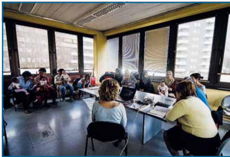
Gli incontri sono tenuti da pediatri e infermiere dei consultori

Nel corso di tre incontri, tenuti da pediatri e infermiere degli stessi consultori, i partecipanti hanno avuto modo di approfondire le tematiche relative all'accudimento del bambino, focalizzandosi sui diversi modelli educativi e di maternage. Attraverso lezioni frontali alternate a momenti di discussione su casi pratici, sono stati trattati argomenti quali l'allattamento e l'introduzione di nuovi alimenti, lo sviluppo psico-motorio del bambino e il progetto GenitoriPiù che prevede 8 azioni per